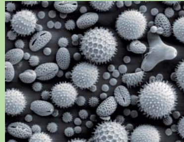
Dartmouth Electron Microscope Facility, Dartmouth College